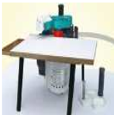
ПОДСТАВКА ДЛЯ МАЛЕНЬКИХ ЗАГОТОВОК