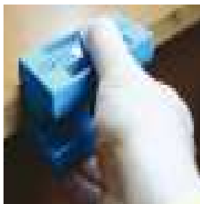
РУЧНАЯ МАШИНКА ДЛЯ СНЯТИЯ СВЕСОВ