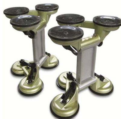
2 УЗЛА С ПРИСОСКАМИ