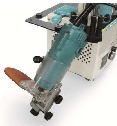
ЭЛЕКТРИЧЕСКИЙ ФРЕЗЕР ДЛЯ КРОМКИ