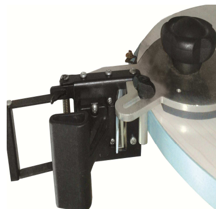
РЕЗАК ДЛЯ ФИГУРНЫХ ЗАГОТОВОК