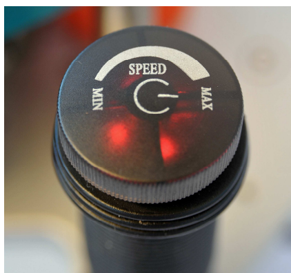
РУЧКА С ВАРИАТОРОМ СКОРОСТИ, 1-4 М/МИН