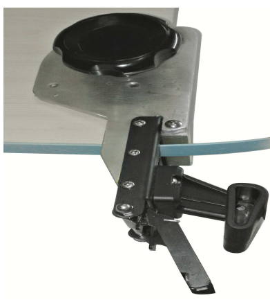
РЕЗАК ДЛЯ ПРЯМЫХ ЗАГОТОВОК