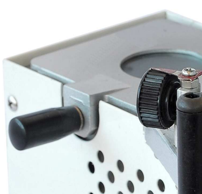
ВАННОЧКА ДЛЯ КЛЕЯ 300 МЛ